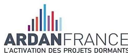
Version avec la base line

- Le site internet www.ardan-france.fr a été mis en ligne en novembre 2017. Il a pour objet de faire connaître le dispositif ARDAN, valoriser les actions et résultats des ARDAN territoriaux et du réseau des promoteurs locaux, contribuer au sourcing des projets et des pilotes, construire un espace collaboratif.